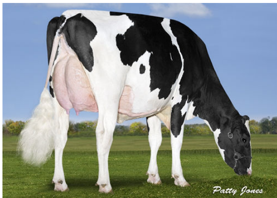
MAPLE WOOD CGAIN LOTTO P